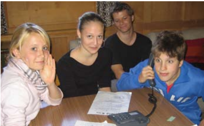
Per Telefon-Interview wurden die Teilnehmenden des Polysportiv-Lagers in Klosters befragt.

«Ich bi Energiedetektivin und ha mi gmäldet, um bi Radio X go Live-interview z mache. Und so ischs mir derby ergange: Ich bi am Moorgä ufgschande und denne scho sehr nervös gsi. Ich bi sehr ufgregt gsi, will ich nid gwüst ha, öb ichs richtig mache wird. Ich ha dänggt, dass ich, wenn ich dr Teggscht e paar Mool durelis , denne nüm eso ufgregt sy wird. Und eso ischs mir eigentlich wirkliigg besser gange, aber nonig ganz guet.