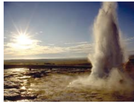
Ein Geysir in Aktion

Sicher hast du noch ein anderes Bild vor Augen, wenn du an die glühende Hitze denkst, die im Erdinnern herrscht. Genau, die Vulkane! Und natürlich die Geysire, die heissen Quellen, die du vielleicht schon einmal in den Ferien in Italien oder in der Türkei besucht hast. Geysire sind die Springbrunnen der Natur. Sie fördern heisses Wasser zu Tage, das sich im heissen Gestein der Erdkruste aufgeheizt hat. Heisses Wasser dehnt sich aus und will entweichen, das kennst du vom Dampfkochtopf oder vom Wasserkocher, der pfeift, wenn das Wasser kocht. Irgendwann ist nicht mehr genügend Platz im Gestein, und das heisse Wasser dringt